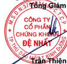
Trần Thiện Thê