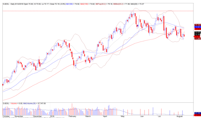
Diễn biến giá của giá dầu Brent

Giá dầu Brent giảm nhẹ 0.87% và vẫn giao dịch dưới đường trung bình 20 ngày. Đồng thời, đồ thị giá của giá dầu Brent vẫn đang trong giai đoạn tích lũy và xu hướng có khả năng sẽ rõ ràng hơn trong phiên giao dịch tới khi giá dầu sẽ đón nhận thông tin về lượng tồn kho dầu của Mỹ theo báo cáo của EIA.