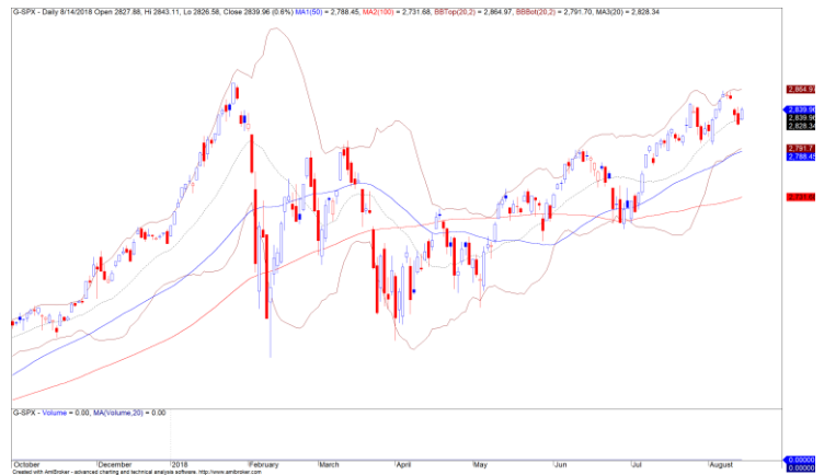
Diễn biến giá của chỉ số S&P500

TTCK Mỹ hồi phục mạnh khi đồng Lira của Thổ Nhĩ Kỳ hồi phục. Chỉ số S&P500 tăng 0.63% và đồ thị giá tiến về gần vùng khoáng trống giảm giá được hình thành trong phiên giao dịch 10/08/2018. Đồng thời, đồ thị giá có khả năng sẽ tiếp tục bước vào giai đoạn hồi phục kỹ thuật và xu hướng ngắn hạn vẫn duy trì ở mức TĂNG.