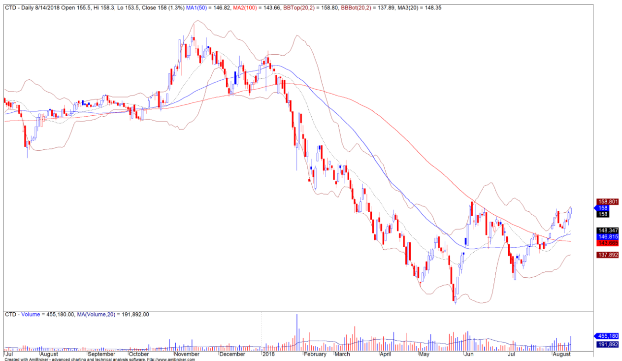
Diễn biến giá của cổ phiếu CTD