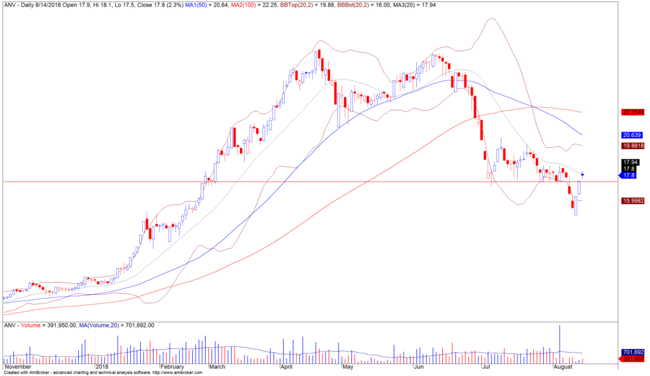
Diễn biến giá của cổ phiếu ANV