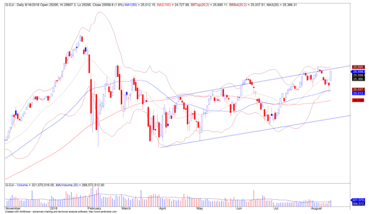
Diễn biến giá của chỉ số Dow Jones

TTCK Mỹ cũng tăng mạnh ở hầu hết các chỉ số khi tâm lý nhà đầu tư đã tích cực hơn sau khi tình hình căng thẳng thương mại đã giảm đáng kể. Chỉ số Dow Jones tăng mạnh hơn 1.5% và đồ thị giá tiến về gần vùng đỉnh cũ với khối lượng giao dịch tăng. Đồng thời, nếu đã