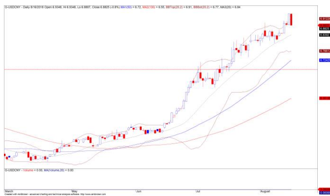
Diễn biến cặp tỷ giá USD/CNY

Đồng USD hạ nhiệt khiến các đồng tiền khác có triển vọng phục tích cực sau khi Trung Quốc đưa ra tuyên bố sẽ đàm phán lại với Mỹ. Cặp tỷ giá USD/CNY điều chỉnh mạnh hơn 0.8% sau chuỗi ngày tăng kéo dài và cảnh báo áp lực điều chỉnh có thể sẽ còn tiếp diễn, điều này cũng sẽ hỗ trợ áp lực lên nhóm đồng tiền của thị trường mới nổi và cận biên, trong đó có Việt Nam.