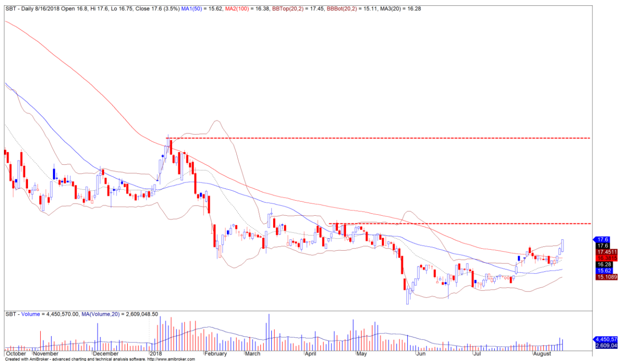
Diễn biến giá của cổ phiếu SBT