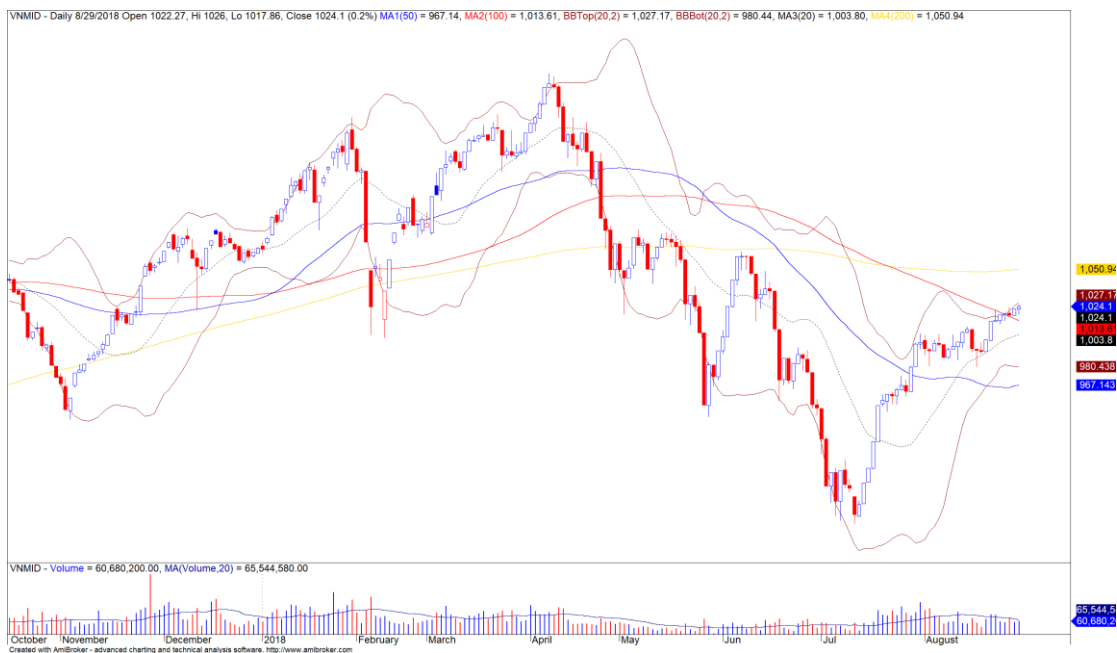
Diễn biến giá của chỉ số VNMidcaps

Nhóm cổ phiếu Midcaps vẫn tiếp tục thu hút dòng tiền ngắn hạn tốt hơn so với các nhóm cổ phiếu khác. Đồng thời, đà thị giá vẫn đang trong giai đoạn biến động mạnh theo chiều hướng tích cực cho thấy xu hướng tăng ngắn hạn tiếp tục được củng cố. Chúng tôi đánh giá dòng tiền sẽ tiếp tục tăng dần vào nhóm cổ phiếu này trong các phiên tới.