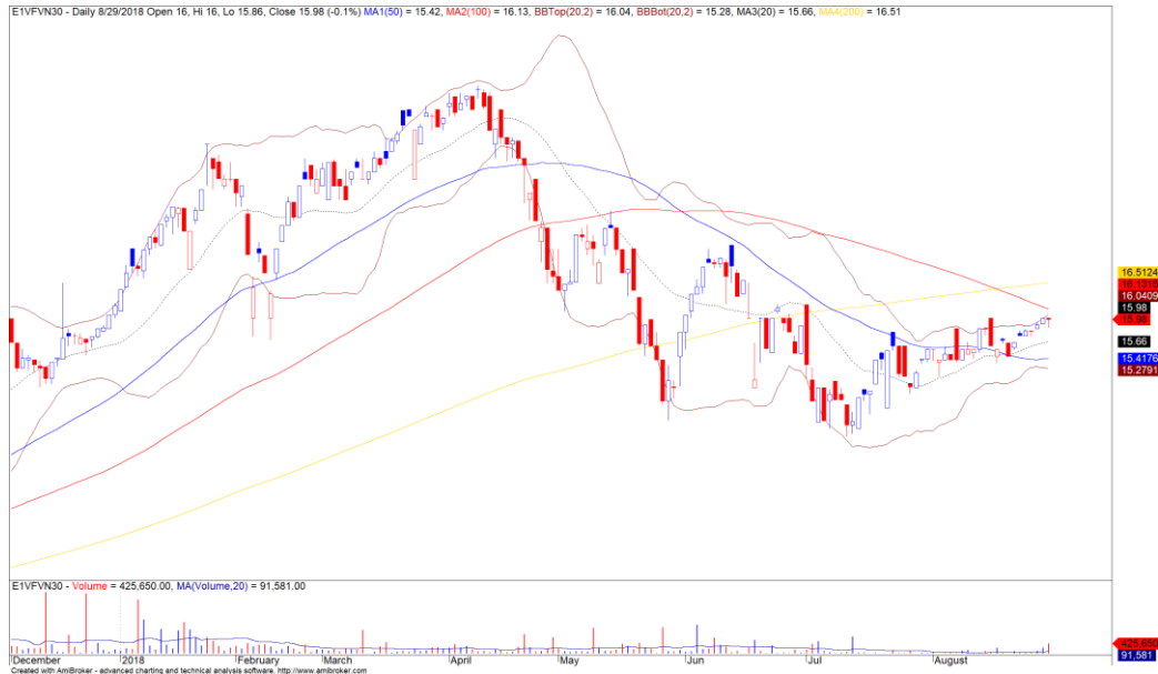
Diễn biến giá của CCQ E1VFN30

Khối ngoại quay trở lại bán ròng hơn 100 tỷ trên cả ba sàn, lượng bán ròng vẫn chủ yếu tập trung ở nhóm Largecaps như VNM, VHM – Đây cũng là những cổ phiếu liên tiếp bị bán ròng trong các giai đoạn trước đó. Điểm tích cực là khối ngoại tiếp tục mua ròng vào CCQ E1VFN30, đặc biệt dòng tiền ngắn hạn duy trì đà tăng mạnh sau giai đoạn giảm trong tháng 06 và tháng 07/2018 cho thấy xu hướng tăng ngắn hạn tiếp tục được củng cố.