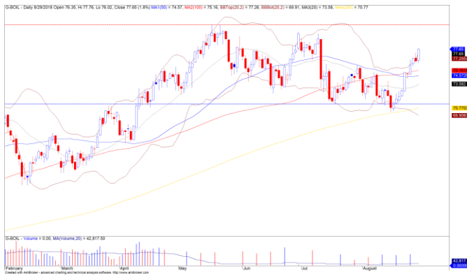
Diễn biến giá của giá dầu Brent

Đồng USD tiếp tục sụt giảm và hỗ trợ cho đà tăng của nhóm hàng hóa. Giá dầu Brent tăng mạnh gần 2% và vượt mức $77/thùng. Đồng thời, đồ thị giá cũng đang tiến về gần vùng đỉnh cũ và đồ thị giá vẫn đang trong giai đoạn biến động mạnh theo chiều hướng tích cực. Ngoài thông tin hỗ trợ về lượng tồn kho dầu của Mỹ sụt giảm thì đồng USD vẫn chưa có dấu hiệu chứng lại đà giảm của mình là những yếu tố hỗ trợ cho đà tăng của giá dầu Brent.