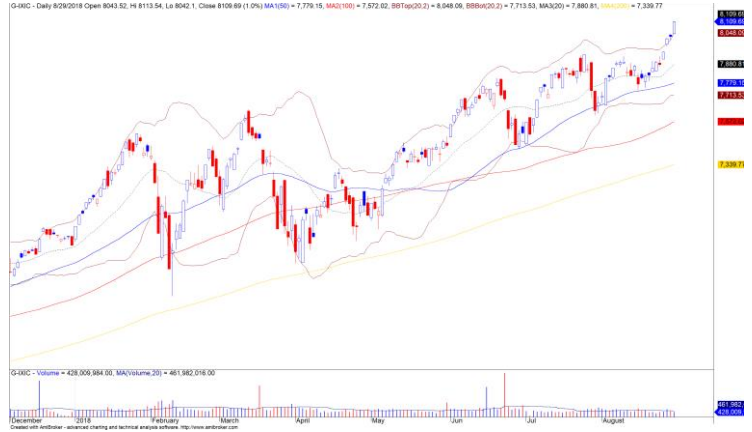
Diễn biến giá của chỉ số Nasdaq

TTCK Mỹ tiếp tục tăng mạnh ở hầu hết các chỉ số chính với sự dẫn dắt của nhóm ngành công nghệ và năng lượng. Chỉ số Nasdaq tăng mạnh gần 1% và đồ thị giá cũng đang bước vào giai đoạn biến động mạnh theo chiều hướng tích cực. Đồng thời, chỉ số này cũng xác lập mức đỉnh kỷ lục mới cho thấy tâm lý nhà đầu tư vẫn đang rất lạc quan