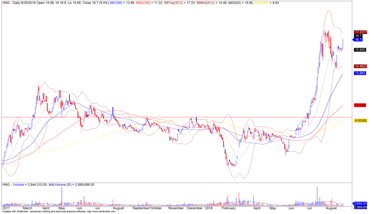
Diễn biến giá của cổ phiếu HNG