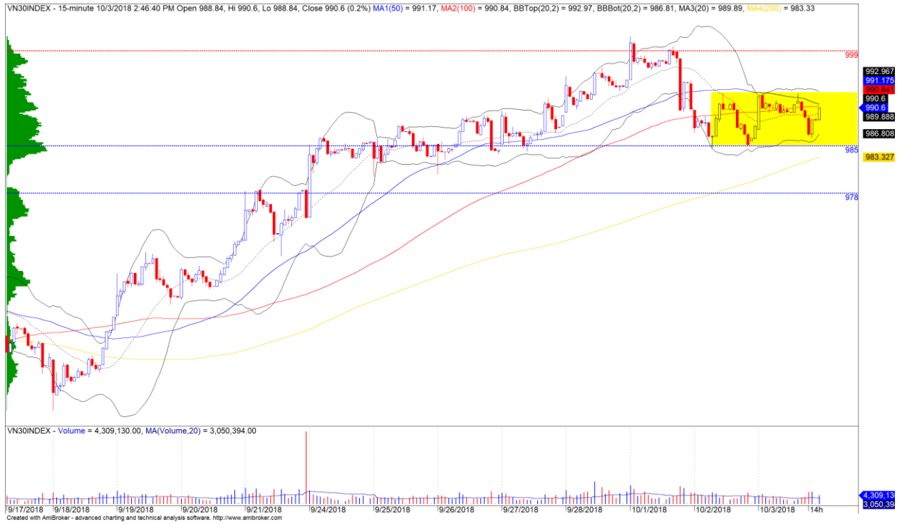
Diễn biến giá của chỉ số VN30 (biểu đồ 15 phút)