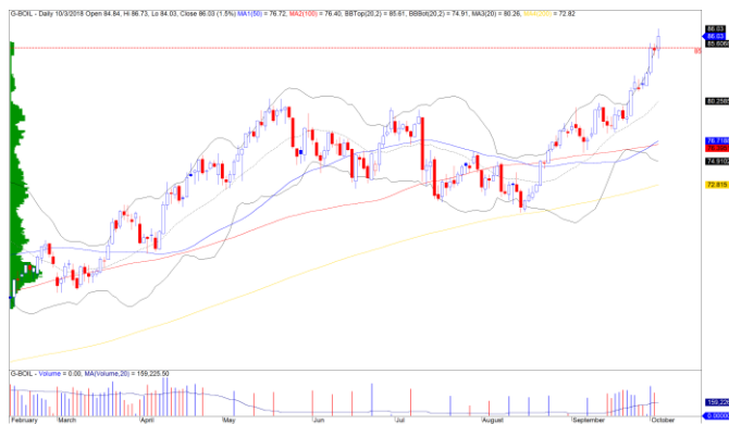
Diễn biến giá của giá dầu Brent

TTCK Mỹ duy trì đà tăng, nhưng mức tăng khá khiêm tốn ở hầu hết các chỉ số chính. Chỉ số Dow Jones tăng nhẹ 0.21% và xuất hiện mô hình cảnh báo đảo chiều giảm. Đồng thời, rủi ro ngắn hạn trên chỉ số này có chiều hướng tăng dần cho nên chúng tôi vẫn nghiêng về kịch bản điều chỉnh trong vài phiên tới.