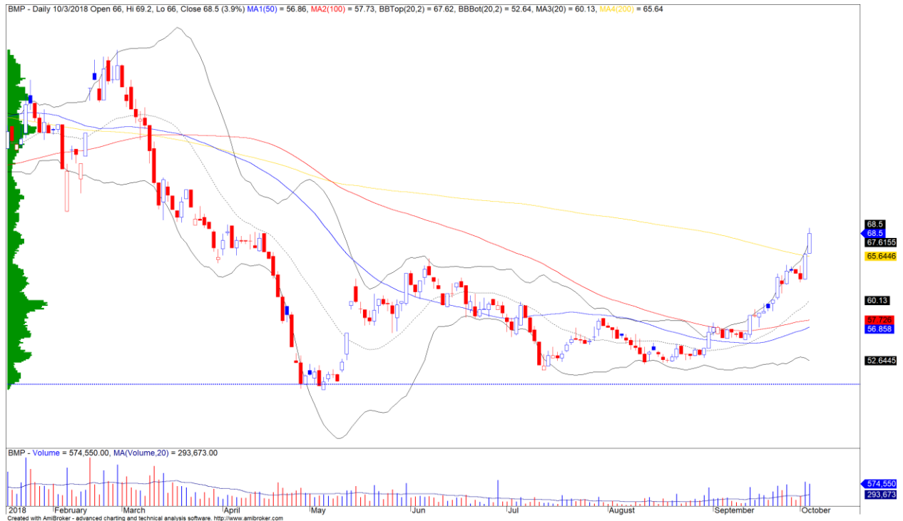
Diễn biến giá của cổ phiếu BMP

Khối ngoại quay trở lại bán ròng nhẹ gần 38 tỷ trên cả ba sàn. Ở chiều mua ròng, STB vẫn là cổ phiếu nổi bật thu hút lượng mua ròng mạnh, kể đến là cổ phiếu BMP cũng được khối ngoại mua ròng mạnh và giúp cổ phiếu này đã tăng gần 30% kể từ thời điểm quỹ DB FTSE loại cổ phiếu này ra trong kỳ cơ cấu danh mục của mình.