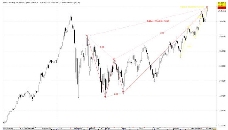
Diễn biến giá của chỉ số Dow Jones

TTCK Mỹ duy trì đà tăng, nhưng mức tăng khá khiêm tốn ở hầu hết các chỉ số chính. Chỉ số Dow Jones tăng nhẹ 0.21% và xuất hiện mô hình cảnh báo đảo chiều giảm. Đồng thời, rủi ro ngắn hạn trên chỉ số này có chiều hướng tăng dần cho nên chúng tôi vẫn nghiêng về kịch bản điều chỉnh trong vài phiên tới.