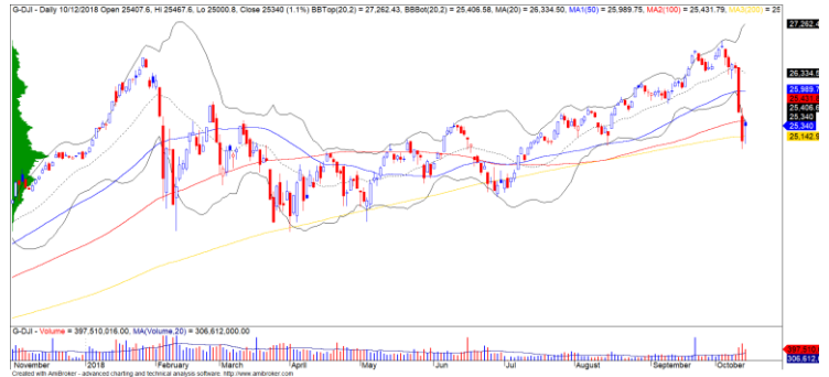
Diễn biến giá của chỉ số Dow Jones

TTCK Mỹ nhanh chóng hồi phục trở lại, đặc biệt chỉ số Dow Jones hồi trên đường trung bình 200 ngày. Đồng thời, đồ thị giá cũng có dấu hiệu bước vào giai đoạn hồi phục kỹ thuật sau giai đoạn giảm mạnh cho nên đồ thị giá chưa thể xuyên thủng đường trung bình 200 ngày.