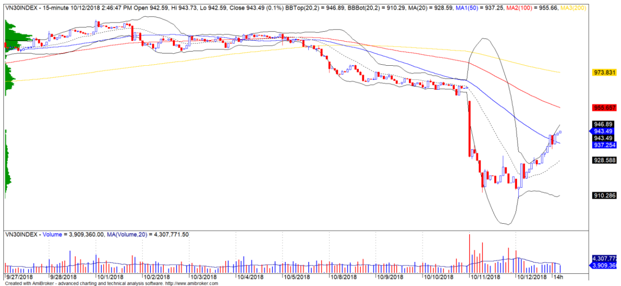
Diễn biến giá của chỉ số VN30