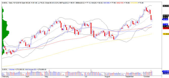
Diễn biến giá của giá dầu Brent

Giá dầu Brent nhanh chóng hồi phục trở lại, đồ thị giá vẫn duy trì trên mức $80/thùng và đồ thị giá xuất hiện mô hình nến Spinning Tops cho thấy đồ thị giá có khả năng sẽ tiếp tục hồi phục trong phiên giao dịch kế tiếp. Đồng thời, đồ thị giá cũng có khả năng sẽ tiếp tục xuất hiện các nhịp hồi kỹ thuật và bước vào trạng thái tích lũy trong tuần giao dịch này.