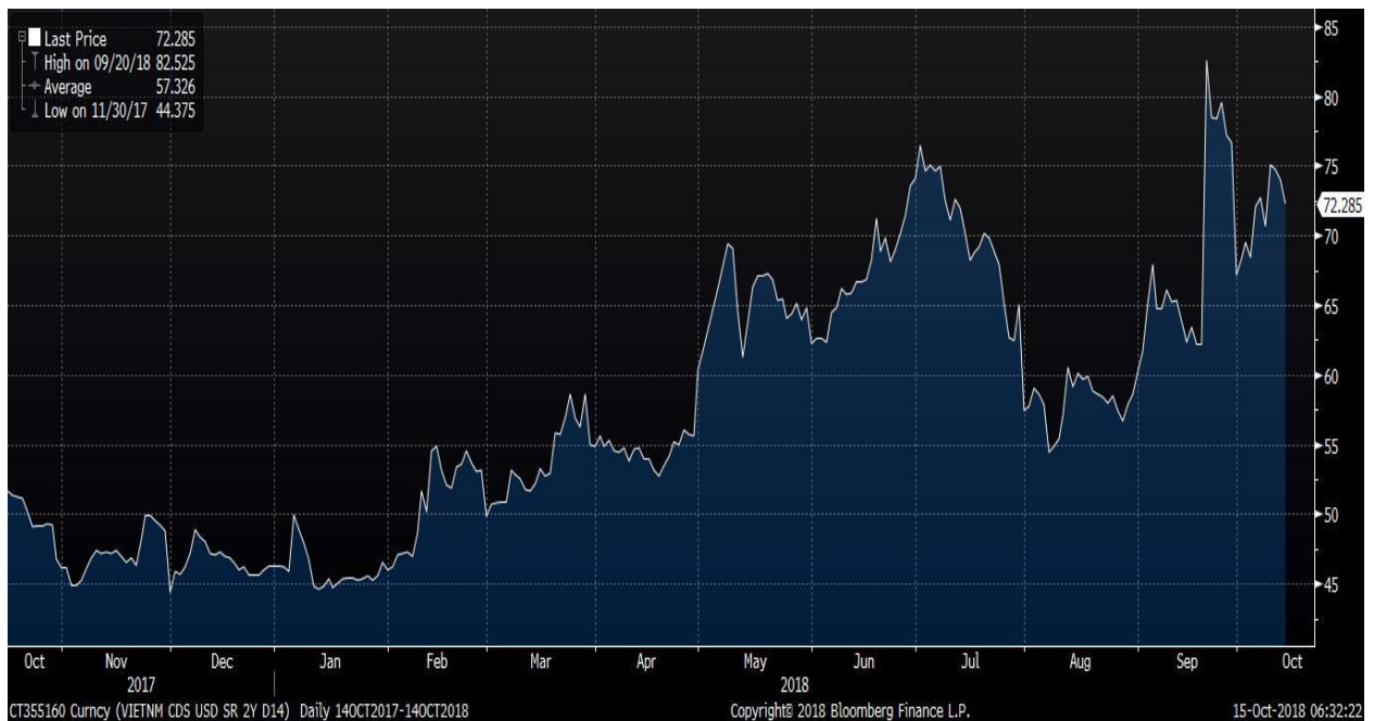
Diễn biến của chỉ số CDS 2 năm

Chỉ số CDS 2 năm đã hạ nhiệt mặc dù tỷ giá vẫn duy trì ở mức cao cho thấy rủi ro ngắn hạn của thị trường vốn tại Việt Nam đang giảm dần, đặc biệt chỉ số này đã hạ nhiệt kể từ khi FTSE quyết định đưa TTCK VN vào danh mục theo dõi nâng hạng lên nhóm thị trường mới nổi hạng 2 và Fitch nâng hạng mức tín nhiệm Việt Nam. Điều này cho thấy áp lực bán ròng của khối ngoại sẽ giảm dần trong ngắn hạn.