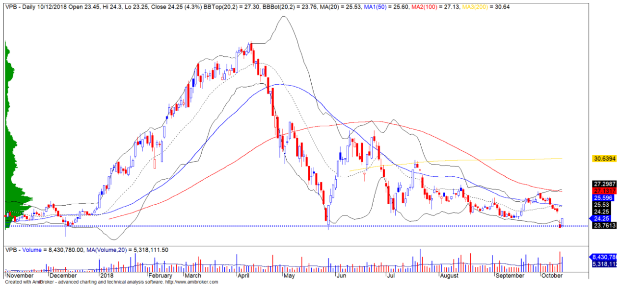
Diễn biến giá của cổ phiếu VPB

Khối ngoại quay trở lại mua ròng mạnh hơn 300 tỷ trên cả ba sàn, đặc biệt nhóm ngân hàng được khối ngoại mua ròng mạnh. Đồng thời, chỉ số USD có dấu hiệu suy yếu trở lại cho thấy tình hình tỷ giá có khả năng sẽ hạ nhiệt trở lại trong vài phiên tới và khối ngoại có thể sẽ sớm dừng trạng thái bán ròng trong tuần giao dịch này.