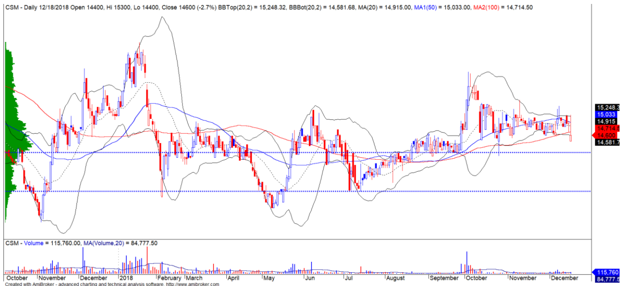
Diễn biến giá của cổ phiếu CSM