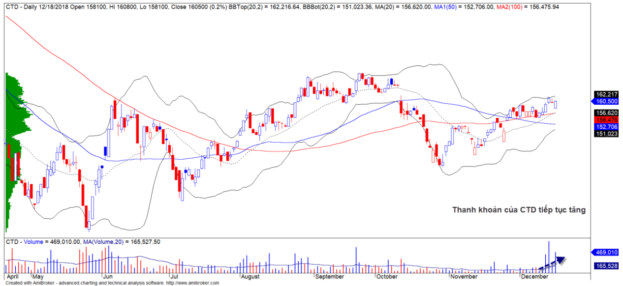
Diễn biến giá của cổ phiếu CTD

Khối ngoại quay trở lại mua ròng mạnh hơn 400 tỷ trên cả ba sàn và chủ yếu từ lượng giao dịch thỏa thuận của PNJ khi cổ phiếu này hở room ngoại trong phiên 18/12/2018. Tuy nhiên, nếu loại trừ lượng giao dịch thỏa thuận này thì khối ngoại vẫn duy trì trạng thái mua ròng và CTD là cổ phiếu tiếp tục được khối ngoại mua ròng mạnh.