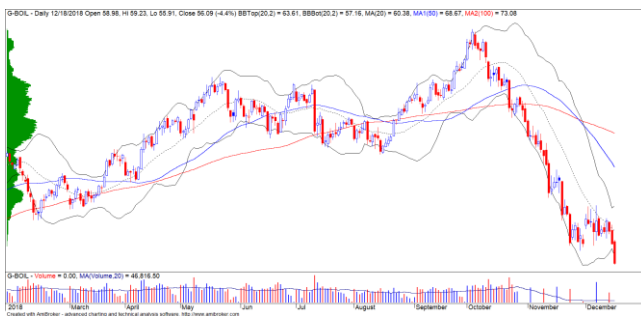
Diễn biến giá của giá dầu Brent

Giá dầu Brent giảm mạnh dưới mức $58/thùng trong bối cảnh lo ngại về nguồn cung của Mỹ sẽ tiếp tục tăng. Đồ thị giá của giá dầu Brent có dấu hiệu bước vào giai đoạn biến động mạnh theo chiều hướng tiêu cực cho thấy rủi ro ngắn hạn sẽ có chiều hướng gia tăng và cho thấy xu hướng giảm ngắn hạn có thể sẽ còn tiếp diễn.