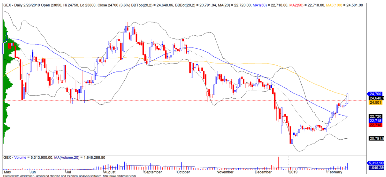
Diễn biến giá của cổ phiếu GEX