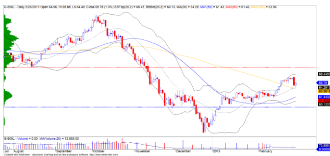
Diễn biến giá của giá dầu Brent

Đồng USD giảm mạnh dưới mức trung bình 20 ngày và xu hướng ngắn hạn của đồng USD cũng đã chuyển hướng tiêu cực. Giá dầu Brent hồi phục nhẹ và đồ thị giá biến động quanh đường trung bình 20 ngày, chúng tôi đánh giá xu hướng tích lũy sẽ còn tiếp diễn và xu hướng ngắn hạn vẫn duy trì ở mức TĂNG .