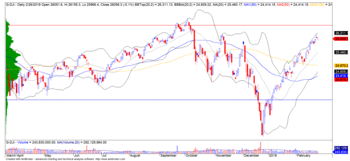
Diễn biến giá của chỉ số Dow Jones

Ảnh hưởng từ TTCK châu Á, TTCK Mỹ cũng điều chỉnh nhẹ sau các phát biểu của chủ tịch Fed. Chỉ số Dow Jones giảm nhẹ 0.14% và vẫn giao dịch quanh mức 26,000 điểm. Đồng thời, rủi ro ngắn hạn cũng có chiều hướng tăng nhẹ, nhưng không quá đáng lo ngại và xu hướng ngắn hạn vẫn duy trì ở mức TĂNG . Do đó, chỉ số Dow Jones có khả năng sẽ tiếp tục hướng về mức đỉnh cũ.