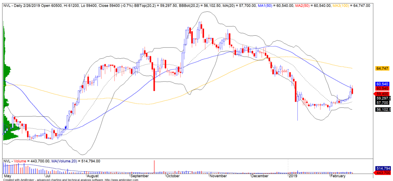
Diễn biến giá của cổ phiếu NVL