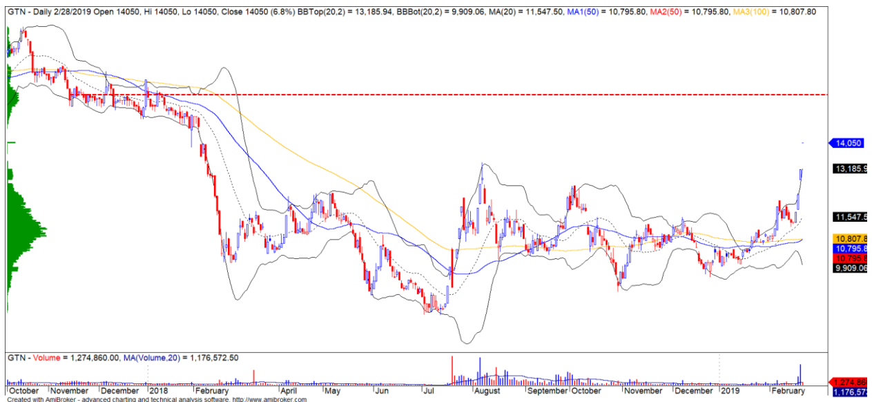
Diễn biến giá của cổ phiếu GTN