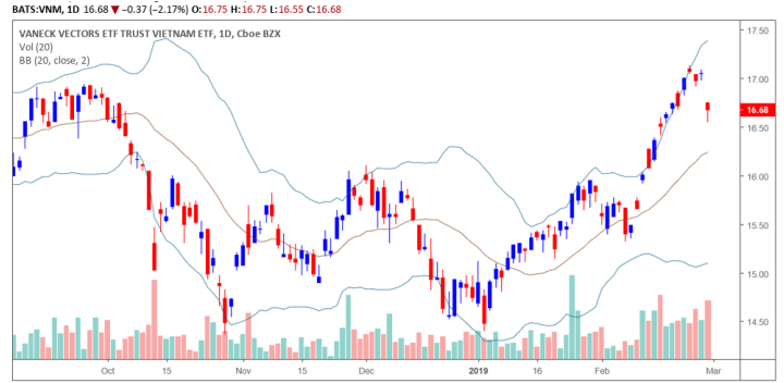
Diễn biến giá của CCQ Van Eck

Giá CCQ Van Eck giảm mạnh hơn 2% với khối lượng giao dịch tăng mạnh do ảnh hưởng tiêu cực từ TTCK VN. Tuy nhiên, xu hướng ngắn hạn vẫn duy trì ở mức TĂNG và đồ thị giá có dấu hiệu sẽ bước vào giai đoạn tích lũy trong những phiên giao dịch tới.