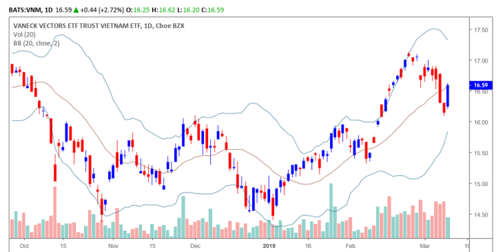
Diễn biến giá của CCQ Van Eck

Giá CCQ Van Eck tăng mạnh về quanh đường trung bình 20 ngày và đồ thị giá có dấu hiệu bước vào giai đoạn tích lũy với khối lượng giao dịch ở mức thấp. Đồng thời, xu hướng ngắn hạn vẫn duy trì ở mức GIẢM, điểm tích cực là tỷ lệ Premium đã hồi phục nhẹ trở lại, nhưng vẫn chưa phải là mức cao để quỹ này sớm hủy động lại.