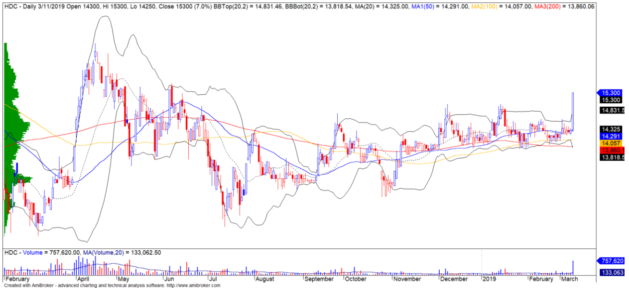
Diễn biến giá của cổ phiếu HDC