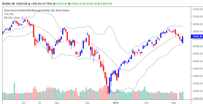
Diễn biến giá của chỉ số Dow Jones

TTCK Mỹ hồi phục mạnh sau phát biểu của chủ tịch Fed, chỉ số Dow Jones tăng gần 0.8% và đồ thị giá vẫn có dấu hiệu bước vào giai đoạn tích lũy, nhóm cổ phiếu ngành công nghệ tăng mạnh trở lại sau khi giới đầu tư kỳ vọng lạc quan về nhóm này trong những quý tới.