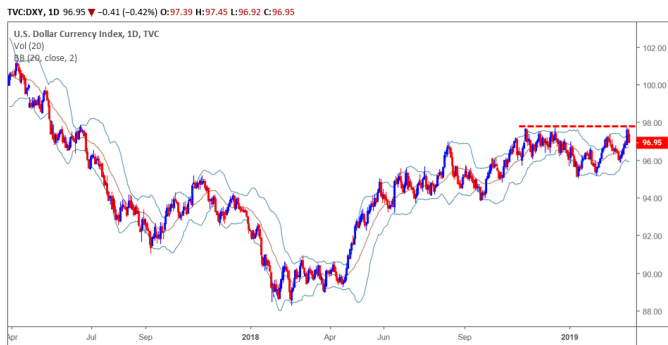
Diễn biến giá của chỉ số USD

Đồng USD nhanh chóng quay đầu giảm mạnh sau phát biểu của Fed về việc sẽ không vội tăng lãi suất và đánh giá mức lãi suất hiện tại là hợp lý với tăng trưởng của nền kinh tế. Theo CME, xác suất Fed không tăng lãi suất trong Q2/2019 là rất cao cho nên chúng tôi đánh giá đồng USD sẽ chưa thể vượt được mức 98 trong ngắn hạn và tạo tính ổn định cho các đồng tiền khác, đặc biệt là đồng tiền mới nổi dự báo sẽ duy trì xu hướng tăng trong Q2/2019.