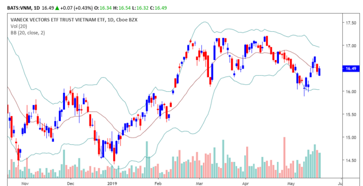
Diễn biến giá của CCQ Van Eck