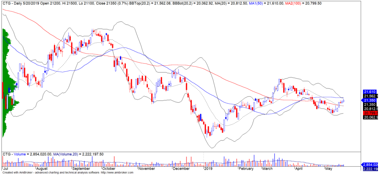
Diễn biến giá của cổ phiếu CTG