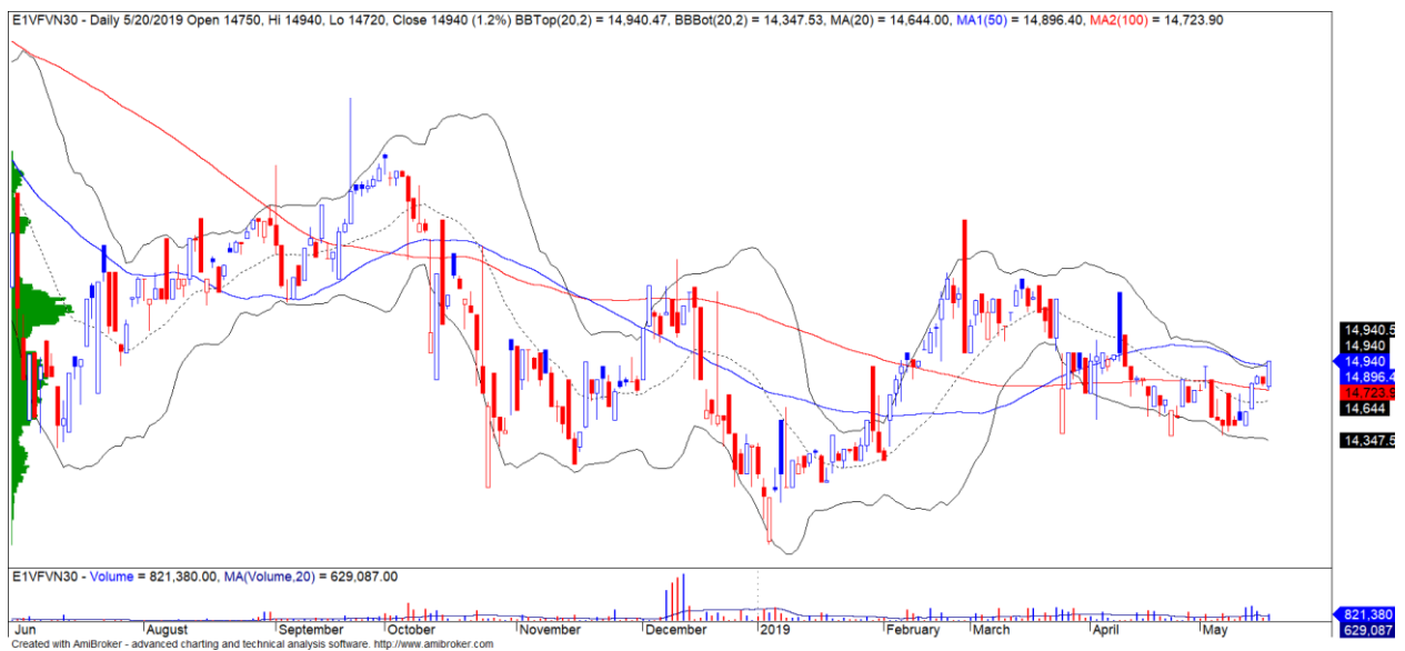
Diễn biến giá của CCQ E1VFN30