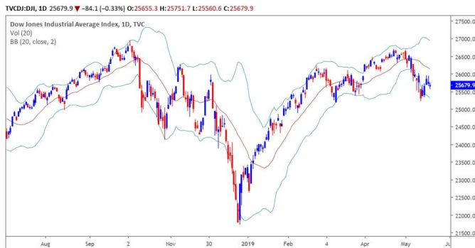
Diễn biến giá của chỉ số Dow Jones

Giá CCQ Van Eck tăng nhẹ +0.43% với khối lượng giao dịch vẫn duy trì ở mức cao.