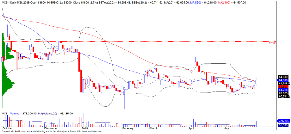
Diễn biến giá của cổ phiếu VCS