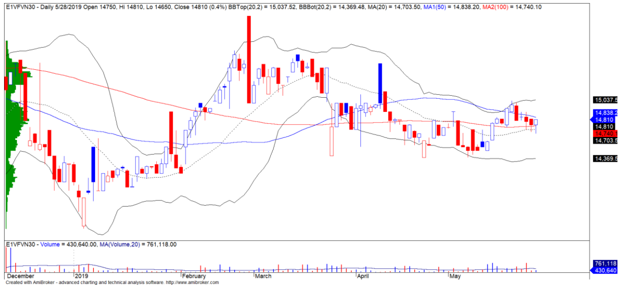
Diễn biến giá của CCQ E1VFN30

Khối ngoại mua ròng nhẹ chỉ gần 2 tỷ trên cả ba sàn. Khối ngoại có thể sẽ tích cực giao dịch hơn trong các phiên giao dịch cuối tuần khi gần đến ngày cuối cùng của kỳ cơ cấu quý 2/2019 của quỹ iShares MSCI Frontier 100 ETF. Điểm tích cực chúng tôi nhận thấy là khối ngoại quay trở lại mua ròng CCQ E1VFN30 cho thấy các hoạt động “redeem” trước đó của khối ngoại đã không còn.