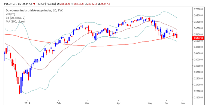
Diễn biến giá của chỉ số Dow Jones