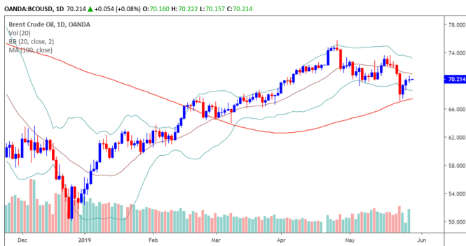
Diễn biến giá của giá dầu Brent

Giá dầu Brent vẫn duy trì trên mức $70/thùng và đồ thị giá vẫn giao dịch trên đường trung bình 100 ngày. Đồng thời, đồ thị giá vẫn đang trong giai đoạn tích lũy cho nên đồ thị giá có thể sẽ tiếp tục biến động hẹp trong ngắn hạn. Ngoài ra, xu hướng ngắn hạn vẫn duy trì ở mức GIẢM.