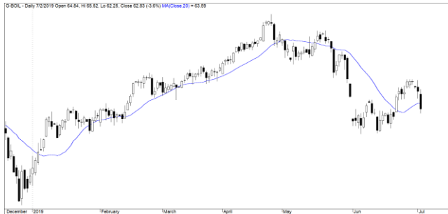
Diễn biến giá của giá dầu Brent

Giá dầu Brent giảm mạnh gần 4% trong bối cảnh lo ngại về suy thoái kinh tế toàn cầu sau khi hoạt động sản xuất giảm xuống ở hầu hết châu Âu và châu Á. Đồng thời, hoạt động sản xuất của Mỹ cũng chậm lại gần như ở mức thấp nhất trong 3 năm. Đồ thị giá của giá dầu Brent giảm dưới đường trung bình 20 ngày và có dấu hiệu bước vào giai đoạn tích lũy. Ngoài ra, xu hướng ngắn hạn của giá dầu Brent bị hạ từ mức TĂNG xuống GIẢM.