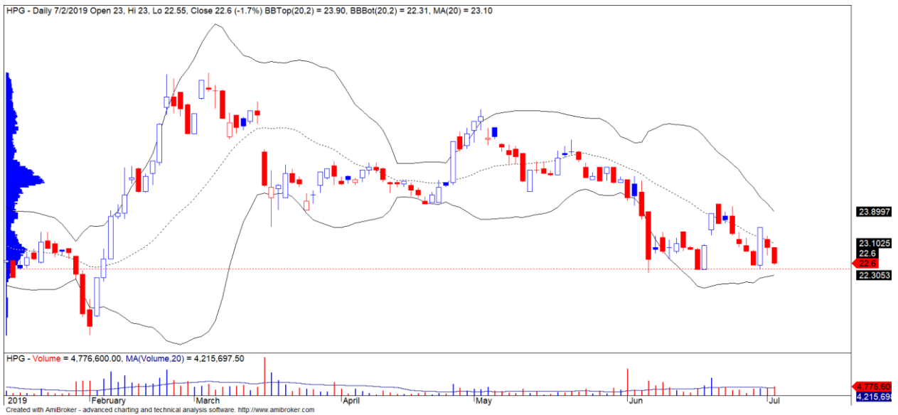
Diễn biến giá của cổ phiếu HPG