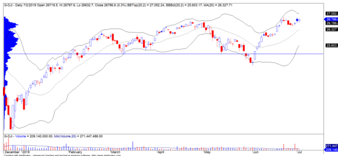
Diễn biến giá của chỉ số Dow Jones

Phố Wall đóng cửa tăng nhẹ ở hầu hết các chỉ số , đặc biệt mức độ thanh khoản vẫn ở mức thấp cho thấy dòng tiền có dấu hiệu suy yếu trong bối cảnh giá dầu giảm mạnh và căng thẳng thương mại Mỹ - châu Âu lại tiếp tục leo thang. Chỉ số Dow Jones đóng cửa tăng nhẹ 0.25% và rủi ro ngắn hạn có dấu hiệu gia tăng dần cho thấy khả năng vượt mức đỉnh ngắn hạn được chúng tôi đánh giá thấp.