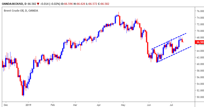
Diễn biến giá của giá dầu Brent

Giá dầu Brent điều chỉnh nhẹ và đồ thị giá vẫn đang trong giai đoạn tích lũy. Xu hướng ngắn hạn vẫn duy trì ở mức TĂNG và rủi ro ngắn hạn vẫn ở mức thấp, nhiều khả năng trạng thái tích lũy này có thể sẽ còn tiếp diễn trong những phiên tới.