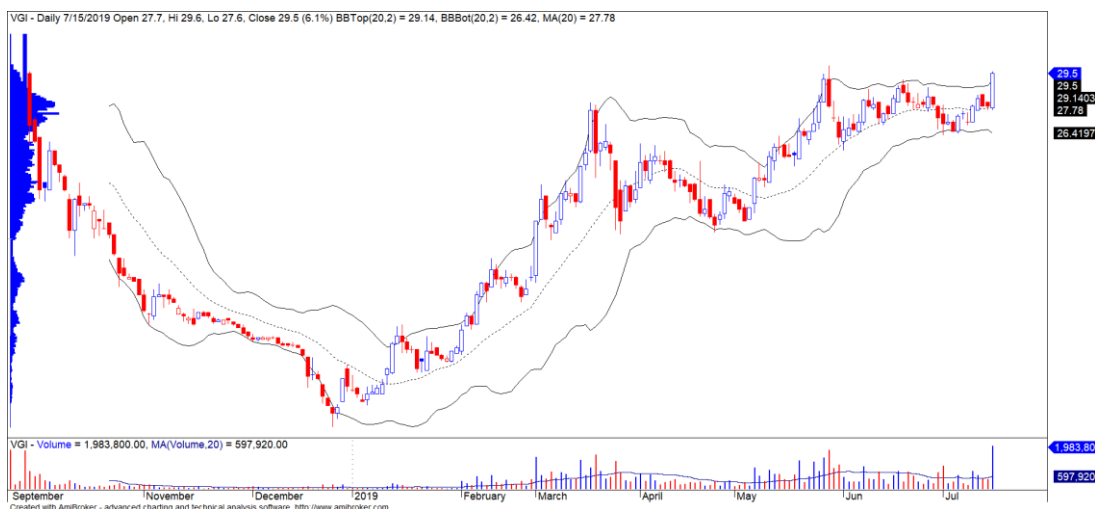
Diễn biến giá của cổ phiếu VGI

(*) Mức Stock Rating là mức so sánh tương quan về mức tăng trưởng cơ bản và sức mạnh tương đối giá cổ phiếu của doanh nghiệp so với các cổ phiếu còn lại trên cả ba sàn của TTCK Việt Nam.