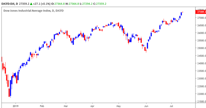
Diễn biến giá của chỉ số Dow Jones

TTCK Mỹ tiếp tục đà tăng khi tâm lý nhà đầu tư lạc quan hơn về KQKD quý 2/2019. Chỉ số Dow Jones đóng cửa tăng nhẹ 0.1% và xác lập mức đỉnh lịch sử mới. Đồng thời, đồ thị giá cũng có dấu hiệu bước vào giai đoạn biến động mạnh theo chiều hướng tích cực và rủi ro ngắn hạn vẫn ở mức thấp.