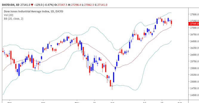
Diễn biến giá của chỉ số Dow Jones

TTCK Mỹ đóng cửa sắc đỏ sau KQKD quý 2/2019 yếu hơn mong đợi và giới đầu tư không ít lo ngại về việc Fed sẽ có động thái khác khi ECB giữ nguyên lãi suất. Chỉ số Dow Jones đóng cửa giảm -0.47% và đồ thị giá tiếp tục có dấu hiệu bước vào giai đoạn tích lũy. Đồng thời, xu hướng ngắn hạn vẫn duy trì ở mức TĂNG.