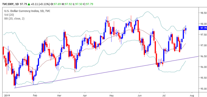
Diễn biến giá của chỉ số USD

ECB đã quyết định giữ nguyên lãi suất và kỳ vọng lãi suất có thể sẽ duy trì ở mức hiện tại hoặc thấp hơn trong nửa đầu năm 2020. Ngân hàng cũng chỉ ra rằng họ đã chuẩn bị cho việc nới lỏng định lượng hơn. Điều này đã khiến đồng USD tiếp tục trở nên mạnh mẽ hơn so với đồng EUR. Tuy nhiên, khả năng Fed vẫn có thể sẽ quyết định cắt giảm lãi suất trong cuộc họp ngày 31/07/2019 cho thấy đà hồi phục của đồng USD đang là xu hướng tạm thời.