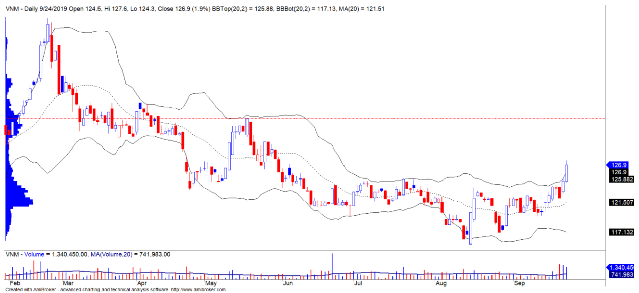
Diễn biến giá của cổ phiếu VNM