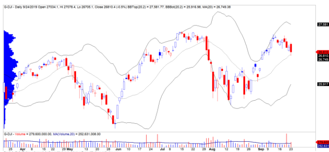
Diễn biến giá của chỉ số Dow Jones

TTCK Mỹ đảo chiều giảm điểm về cuối phiên khi Tổng thống Trump công kích mạnh mẽ Trung Quốc, điều này đã khiến giới đầu tư lo ngại về cuộc đàm phán thương mại không thành công. Chỉ số Dow Jones điều chỉnh -0.52% và đồ thị giá có dấu hiệu bước vào giai đoạn tích lũy cho nên chúng tôi nghi ngờ về cho nên chúng tôi đánh giá chỉ số này có thể sẽ tiếp tục trạng thái tích lũy quanh vùng giá 26,750 điểm,