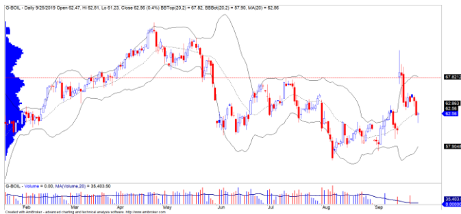
Diễn biến giá của giá dầu Brent

Lượng tồn kho dầu của Mỹ tiếp tục tăng trng tuần thứ 2 liên tiếp, điều này đã khiến giá dầu Brent giảm mạnh vào đầu phiên mở cửa, nhưng đã giảm thu hẹp và giá dầu đóng cửa tăng nhẹ +0.4%. Đồng thời, chúng tôi cho rằng giá dầu Brent có thể sẽ tiếp tục tích lũy quanh ngưỡng $63 trong vài phiên tới, nhưng xu hướng ngắn hạn vẫn duy trì ở mức GIẢM.