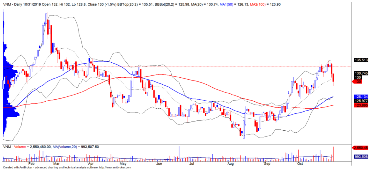
Diễn biến giá của cổ phiếu VNM