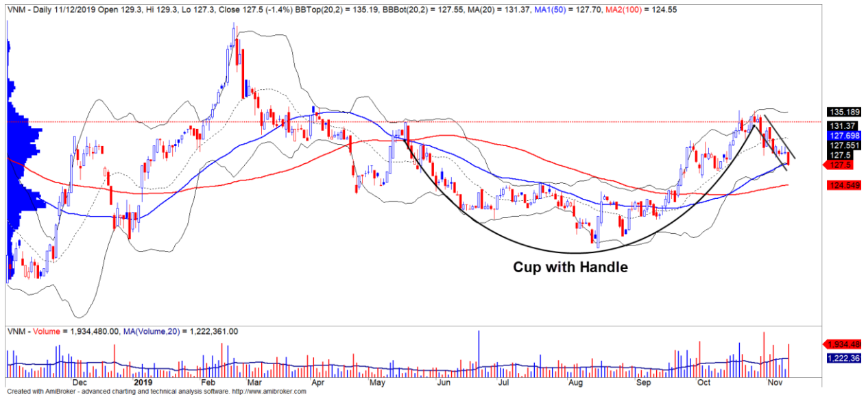
Diễn biến giá của cổ phiếu VNM

Dòng tiền có sự dịch chuyển sang nhóm cổ phiếu vốn hóa nhỏ. Theo hệ thống xếp hạng của chúng tôi, Top 5 cổ phiếu nhóm Smallcaps có mức điểm tăng trưởng (so sánh tương quan về biến động giá) cao nhất. Trong đó, IDJ và TIG là hai cổ phiếu có điểm cơ bản lần lượt là 83 và 87 điểm cho nên rủi ro của hai cổ phiếu này có thể sẽ thấp hơn.