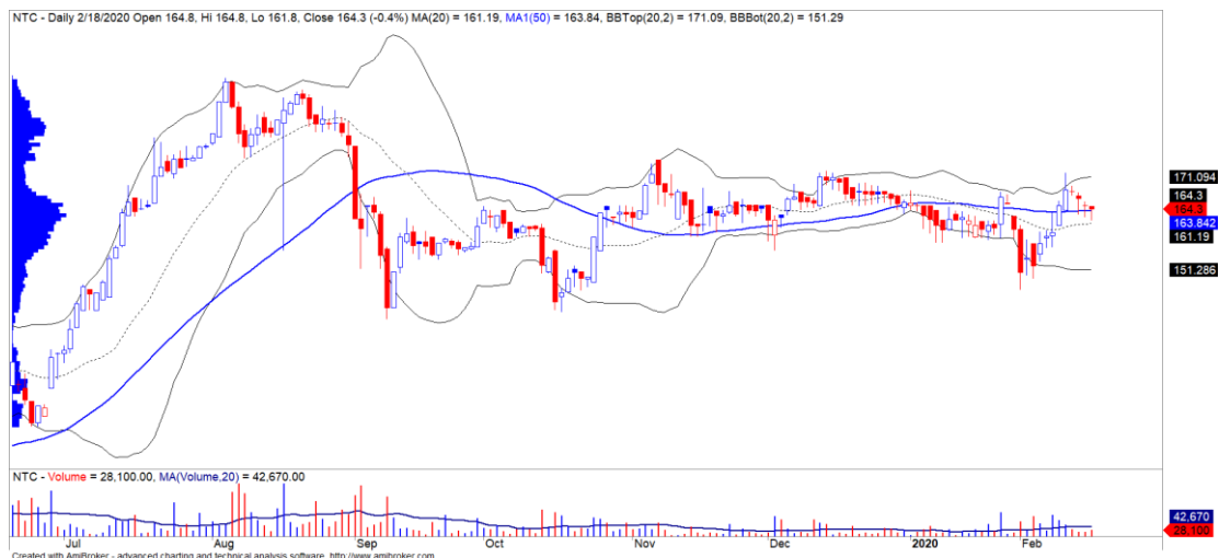
Diễn biến giá của cổ phiếu NTC