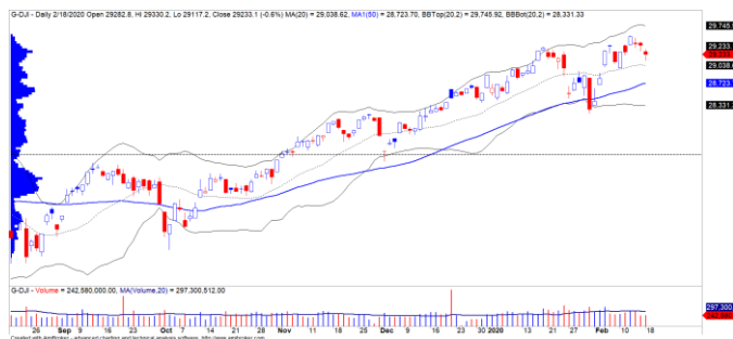
Diễn biến giá của chỉ số Dow Jones

Thị trường Mỹ điều chỉnh ở các chỉ số chính do ảnh hưởng tiêu cực từ TTCK châu Á và châu Âu. Lo ngại về tình hình sản xuất sụt giảm do ảnh hưởng từ virus Corona, tâm lý NĐT thận trọng hơn ở các cổ phiếu sản xuất phụ thuộc vào Trung Quốc, trong đó có Apple. Chỉ số Dow Jones đóng cửa giảm 0.6% và đồ thị giá có dấu hiệu bước vào giai đoạn tích lũy, nhưng dấu hiệu này chưa rõ ràng. Đồng thời, xu hướng ngắn hạn vẫn duy trì ở mức TĂNG.