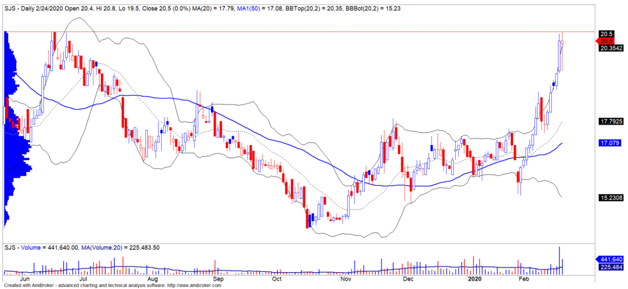
Diễn biến giá của cổ phiếu SJS