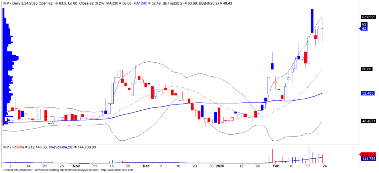
Diễn biến giá của cổ phiếu IMP