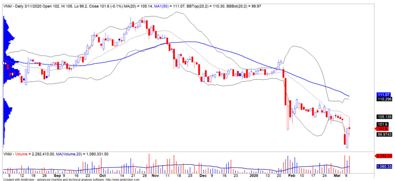
Diễn biến giá của cổ phiếu VNM

Dấu hiệu tạo đáy hình thành. Theo mô hình định lượng của chúng tôi, tỷ trọng cổ phiếu đã giảm về mức 15% và thị trường thường xuất hiện đáy khi tỷ trọng cổ phiếu giảm dưới vùng 20%, mức thấp nhất trong lịch sử là 7% và chiến lược phù hợp trong giai đoạn này là hạn chế bán ra thêm nếu không có áp lực margin trong ngắn hạn. Đồng thời, các nhịp giảm sâu của thị trường ở 1-2 phiên tới thường là cơ hội bất đắy cho nhịp hồi phục ngắn hạn, nhưng khẩu vị này ưu tiên cho các nhà đầu tư có khẩu vị rủi ro cao và lựa chọn nhóm cổ phiếu mạnh nhất thị trường như nhóm cổ phiếu ngân hàng (CTG, BID, VPB, ACB, SHB).