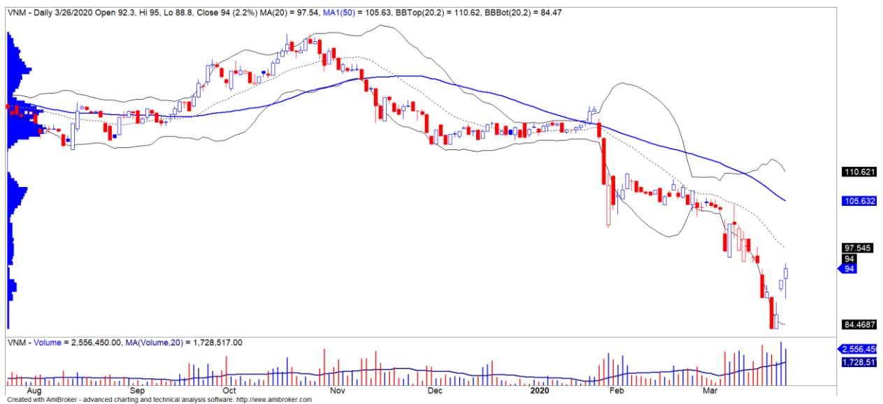
Diễn biến giá của cổ phiếu VNM