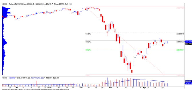
Diễn biến giá của chỉ số Dow Jones

TTCK Mỹ gặp khó trước các vùng kháng cự ngắn hạn. Chỉ số Dow Jones đã có tuần điều chỉnh gần 2%, nhóm cổ phiếu ngành công nghệ vẫn có đà tăng tốt nhất so với các nhóm ngành khác. Tuy nhiên, vùng kháng cự mạnh của chỉ số Dow Jones là 23,890 – 25,233 điểm và chúng tôi đánh giá chỉ số này khó có thể vượt được hoàn toàn vùng kháng cự này. Xu hướng ngắn hạn của chỉ số Dow Jones duy trì ở mức TĂNG.