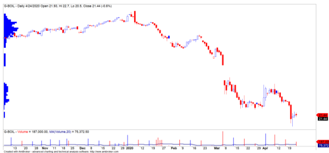
Diễn biến giá của giá dầu Brent

Giá dầu Brent đã có tuần biến động mạnh. Kho chứa dầu không còn đủ đã khiến nhà đầu tư phải bán tháo dầu và khiến giá dầu Brent giảm hơn 23% trong tuần giao dịch 20 – 24/04/2020. Chúng tôi đã có báo cáo đánh giá mức độ tác động của giá dầu lên nền kinh tế và đưa ra hai kịch bản cho giá dầu Brent trong giai đoạn tới (tham khảo chi tiết tại: https://yuanta.com.vn/phan-tich/bao-cao-chuyen-de-26-04-2020-tac-dong-cua-gia-dau-va-cac-kich-ban ).